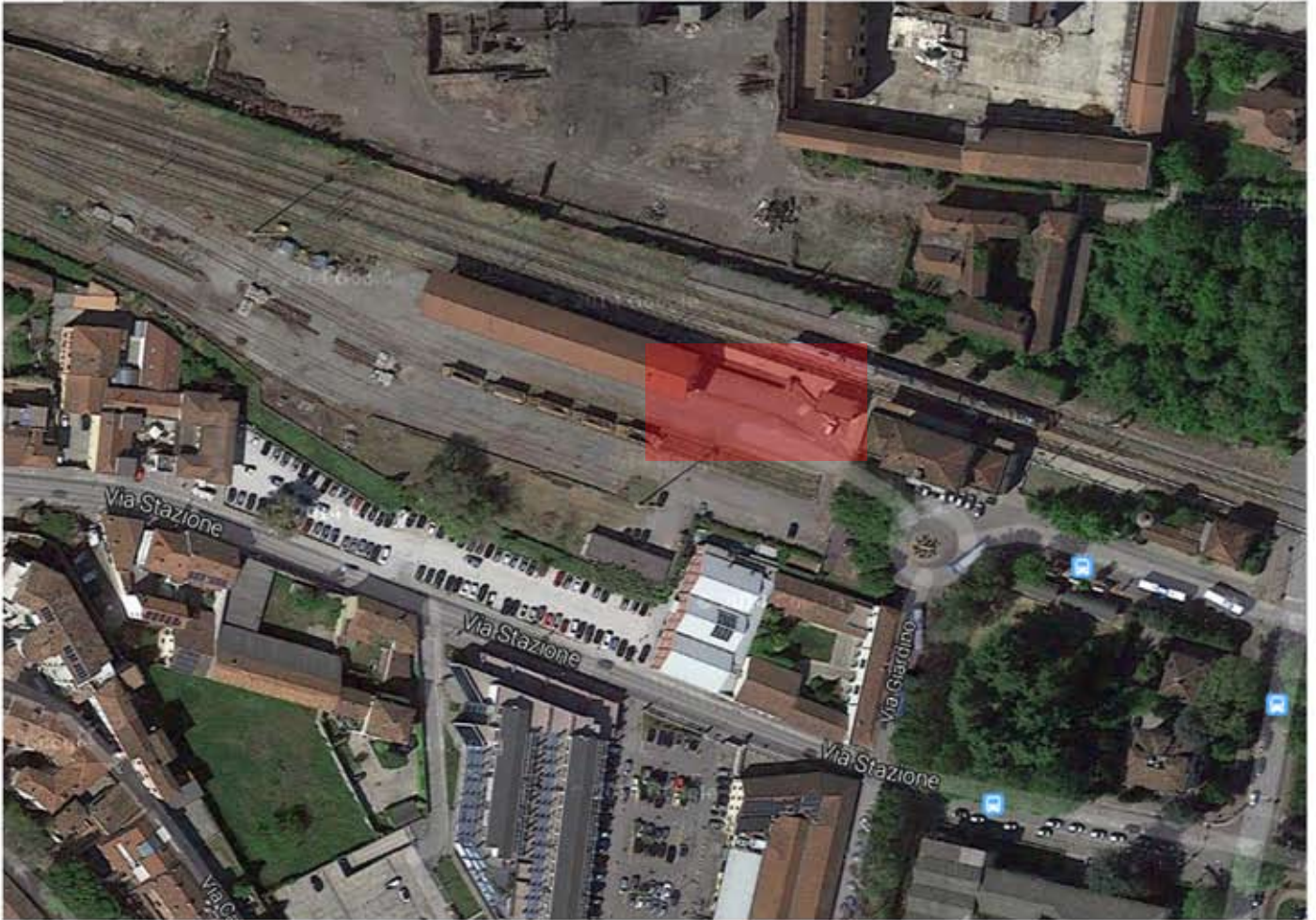
Area di intervento