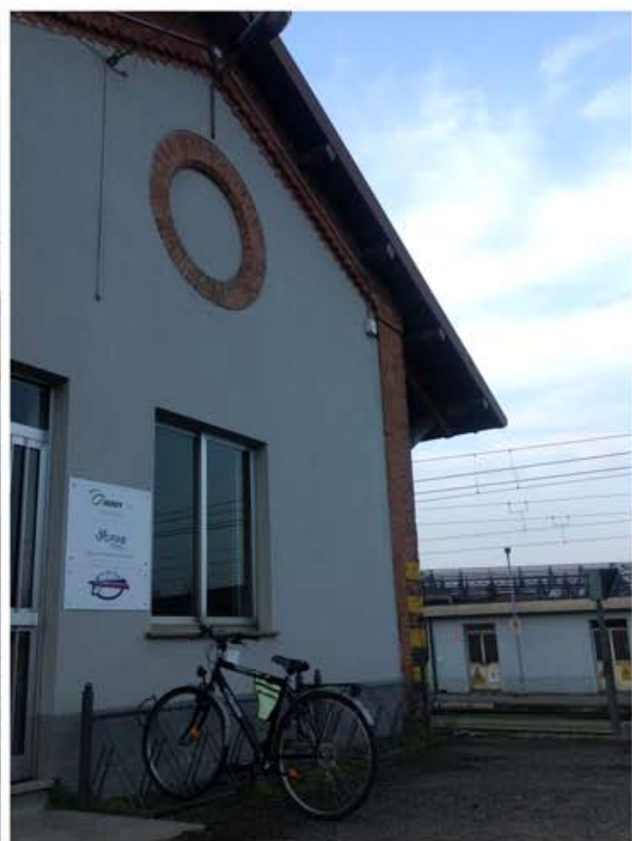
Edificio adiacente all'area di intervento