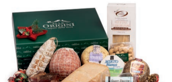
CONFEZIONE BALLETTINO IN CARTONE

SALAME STAGIONATO GENTILE gr 500 C.A. - Futura Salumi COTECCHINO A BOCCIA NOSTRANO gr 1000 C.A. - Futura Salumi SPECK gr 500 C.A. - Futura Salumi PARMIGIANO REGGIANO STRAVECCHIO 36 MESI gr 900/1000 C.A. FORMAGGIO MUFFETTATO DI CAPRA "MIRTO BIANCO" gr 300 C.A. PECORINO TOSCANO "IL GRULLO" - gr 500 C.A. CACIOTTA AFFINATA CON ERBE E FIORI "FIOR DI BRUNA" - gr 600 C.A. FORMAGGIO SPALMABILE - SICIARO VACCINO - gr 160 C.A. FORMAGGIO SPALMABILE - Fior di Capra - gr 160 C.A. LENTICCHIE SECCHE gr 400 PASTA DI SEMOLA DI GRANO DURO "DI MAURO" gr 500 - var 101 CONFEZIONE ARACCHIDI gr 200