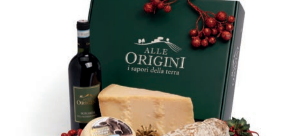
CONFEZIONE BALLETTINO IN CARTONE

BONARDA DELL'OLTREPO PAVESE "SELEZIONE ALLE ORIGINI" ml 750 SALAME STAGIONATO GENTILE gr 500 C.A. - Futura Salumi GRANA PADANO stagionato gr 900/1000 C.A. CACIOTTA RAZZA BRUNA gr 500 C.A.