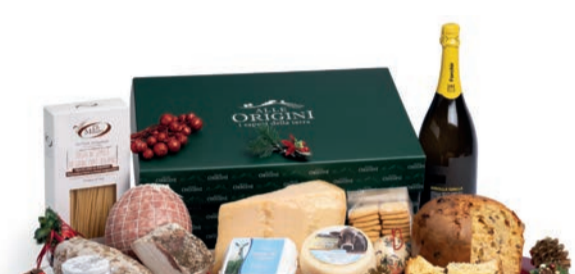
CONFEZIONE BALLETTINO IN CARTONE

PANETTONE GRAN GALUP TRADIZIONALE gr 750 SPUMANTE MAGNIM "RIBOLLA GALLA" BRUT NATURALE FORCHIR" ml 1500 SALAME STAGIONATO GENTILE gr 500 C.A. - Futura Salumi COTECCHINO A BOCCIA NOSTRANO gr 1000 C.A. - Futura Salumi LARDO ALLE ERBE gr 500 C.A. - Futura Salumi GRANA PADANO stagionato gr 900/1000 C.A. CACIOTTA RAZZA BRUNA gr 500 C.A. FORMAGGIO A CROSTA FIORTA - "QUADRELLA DI CAPRA" gr 400 C.A. LENTICCHIE SECCHE gr 400 PASTA DI SEMOLA DI GRANO DURO "DI MAURO" gr 500 - var 101 SUGO "RÖLFI SAPORI ARTIGIANI" VARI GUSTI gr 180 BISCOTTI DI FROLLA "SELEZIONE ALLE ORIGINI" gr 180