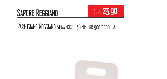
ASTUCCIO IN CARTONE