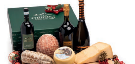
CONFEZIONE BALLETTINO IN CARTONE

SPUMANTE ALLUNGATO BRUT CUVÉE MILLESIMATO EXTRA DRY "SOLIGO" ml 750 NERO DI LAMBRUSCO DELL'EMILIA "OTELLO" ml 750 BONARDA DELL'OLTREPO PAVESE "SELEZIONE ALLE ORIGINI" ml 750 SALAME STAGIONATO GENTILE gr 500 C.A. - Futura Salumi COTECCHINO A BOCCIA NOSTRANO gr 1000 C.A. - Futura Salumi GRANA PADANO stagionato gr 900/1000 C.A. CACIOTTA RAZZA BRUNA gr 500 C.A. LENTICCHIE SECCHE gr 400