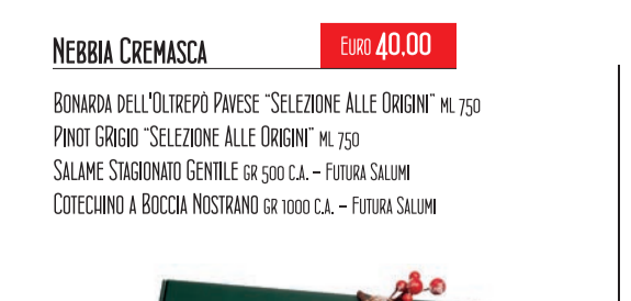
CONFEZIONE BALLETTINO IN CARTONE

PARMIGIANO REGGIANO STRAVECCHIO 36 MESI gr 900/1000 C.A.