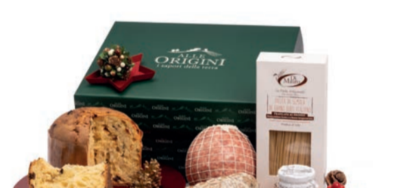
CONFEZIONE BALLETTINO IN CARTONE

PANETTONE GRAN GALUP TRADIZIONALE gr 750 SALAME STAGIONATO GENTILE gr 500 C.A. - Futura Salumi COTECCHINO A BOCCIA NOSTRANO gr 1000 C.A. - Futura Salumi LENTICCHIE SECCHE gr 400 PASTA DI SEMOLA DI GRANO DURO "DI MAURO" gr 500 - var 101 SUGO "RÖLFI SAPORI ARTIGIANI" VARI GUSTI gr 180