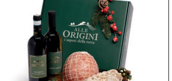
CONFEZIONE BALLETTINO IN CARTONE

GRANA PADANO stagionato gr 900/1000 C.A.