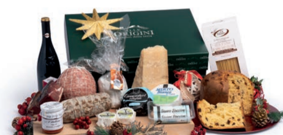
CONFEZIONE BALLETTINO IN CARTONE