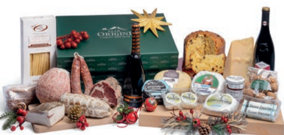
CONFEZIONE BALLETTINO IN CARTONE

PANETTONE GRAN GALUP TRADIZIONALE gr 750 SPUMANTE ALLUNGATO BRUT CUVÉE MILLESIMATO EXTRA DRY "SOLIGO" ml 750 REFRESCO DAL PENDOCULO ROSSO "LA TUNNELLA" ml 750 SALAME STAGIONATO GENTILE gr 500 C.A. - Futura Salumi COTECCHINO A BOCCIA NOSTRANO gr 1000 C.A. - Futura Salumi SALSICCIA PUNTA DI COLTELLO NATURALE gr 400 C.A. - Futura Salumi LARDO ALLE ERBE gr 500 C.A. - Futura Salumi COPPA STAGIONATA - Fior di Capra gr 1000 C.A. - Futura Salumi GRANA PADANO stagionato gr 900/1000 C.A. CACIOTTA "IL GIUSTOSO" gr 100 C.A. CAMEMBERT DI CAPRA gr 300 C.A. CAMEMBERT DI BUFALA gr 300 C.A. FORMAGGIO SPALMABILE - Fior di Capra - gr 160 C.A. FORMAGGIO SPALMABILE - SICIARO VACCINO gr 160 C.A. CACIOTTA CON TARTUFO "PAN DI BRUNA" gr 500 C.A. LENTICCHIE SECCHE gr 400 PASTA DI SEMOLA DI GRANO DURO "DI MAURO" gr 500 - var 101 SUGO "RÖLFI SAPORI ARTIGIANI" VARI GUSTI gr 180 BISCOTTI DI FROLLA "SELEZIONE ALLE ORIGINI" gr 180 CONFEZIONE NOCI gr 250