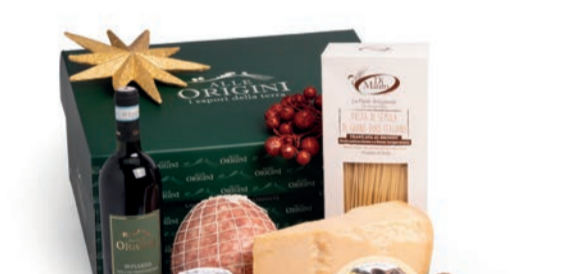
CONFEZIONE BALLETTINO IN CARTONE

BONARDA DELL'OLTREPO PAVESE "SELEZIONE ALLE ORIGINI" ml 750 COTECCHINO A BOCCIA NOSTRANO gr 1000 C.A. - Futura Salumi GRANA PADANO stagionato gr 900/1000 C.A. CACIOTTA RAZZA BRUNA gr 500 C.A. LENTICCHIE SECCHE gr 400 PASTA DI SEMOLA DI GRANO DURO "DI MAURO" gr 500 - var 101 SUGO "RÖLFI SAPORI ARTIGIANI" VARI GUSTI gr 180