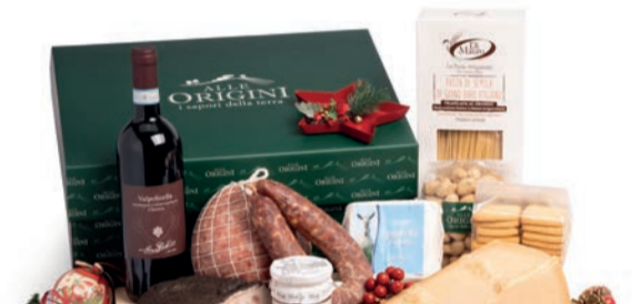
CONFEZIONE BALLETTINO IN CARTONE