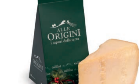
ASTUCCIO IN CARTONE