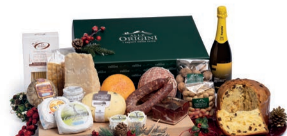
CONFEZIONE BALLETTINO IN CARTONE

PANETTONE GRAN GALUP TRADIZIONALE gr 750 SPUMANTE "RIBOLLA GALLA" BRUT FORCHIR" ml 750 COTECCHINO A BOCCIA NOSTRANO gr 1000 C.A. - Futura Salumi SPECK gr 500 C.A. - Futura Salumi SALSICCIA PUNTA DI COLTELLO NATURALE gr 400 C.A. - Futura Salumi PARMIGIANO REGGIANO STRAVECCHIO 36 MESI gr 900/1000 C.A. FORMAGGIO CAPRINO STAGIONATO - POLENTINA DI CAPRA gr 600 C.A. PECORINO TOSCANO "IL GRULLO" - gr 500 C.A. CAMEMBERT DI CAPRA gr 300 C.A. FORMAGGIO SPALMABILE - Fior di Capra - gr 160 C.A. CAMEMBERT ITALIANO - LOVE - gr 300 C.A. CACIOTTA CON TARTUFO "PAN DI BRUNA" gr 500 C.A. LENTICCHIE SECCHE gr 400 PASTA DI SEMOLA DI GRANO DURO "DI MAURO" gr 500 - var 101 SUGO "RÖLFI SAPORI ARTIGIANI" VARI GUSTI gr 180 FOCACCINE CROCCANTI "SELEZIONE ALLE ORIGINI" gr 120 CONFEZIONE ARACCHIDI gr 200 CONFEZIONE NOCI gr 250