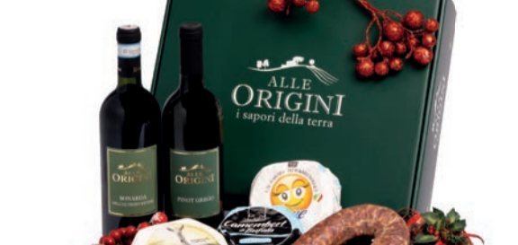
CONFEZIONE BALLETTINO IN CARTONE