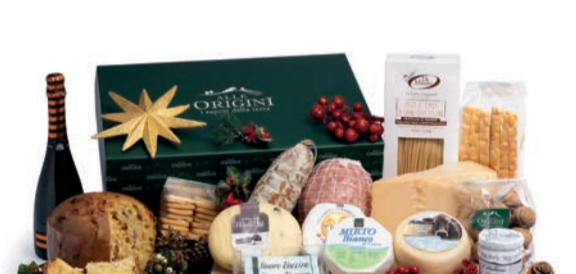
CONFEZIONE BALLETTINO IN CARTONE