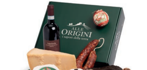
CONFEZIONE BALLETTINO IN CARTONE