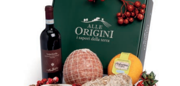
CONFEZIONE BALLETTINO IN CARTONE