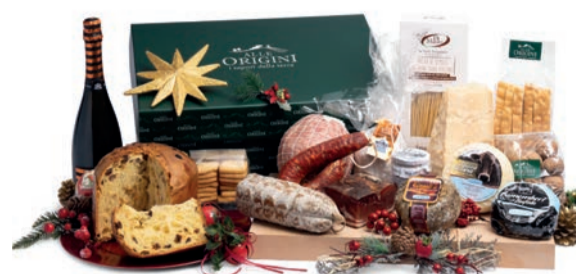
CONFEZIONE BALLETTINO IN CARTONE